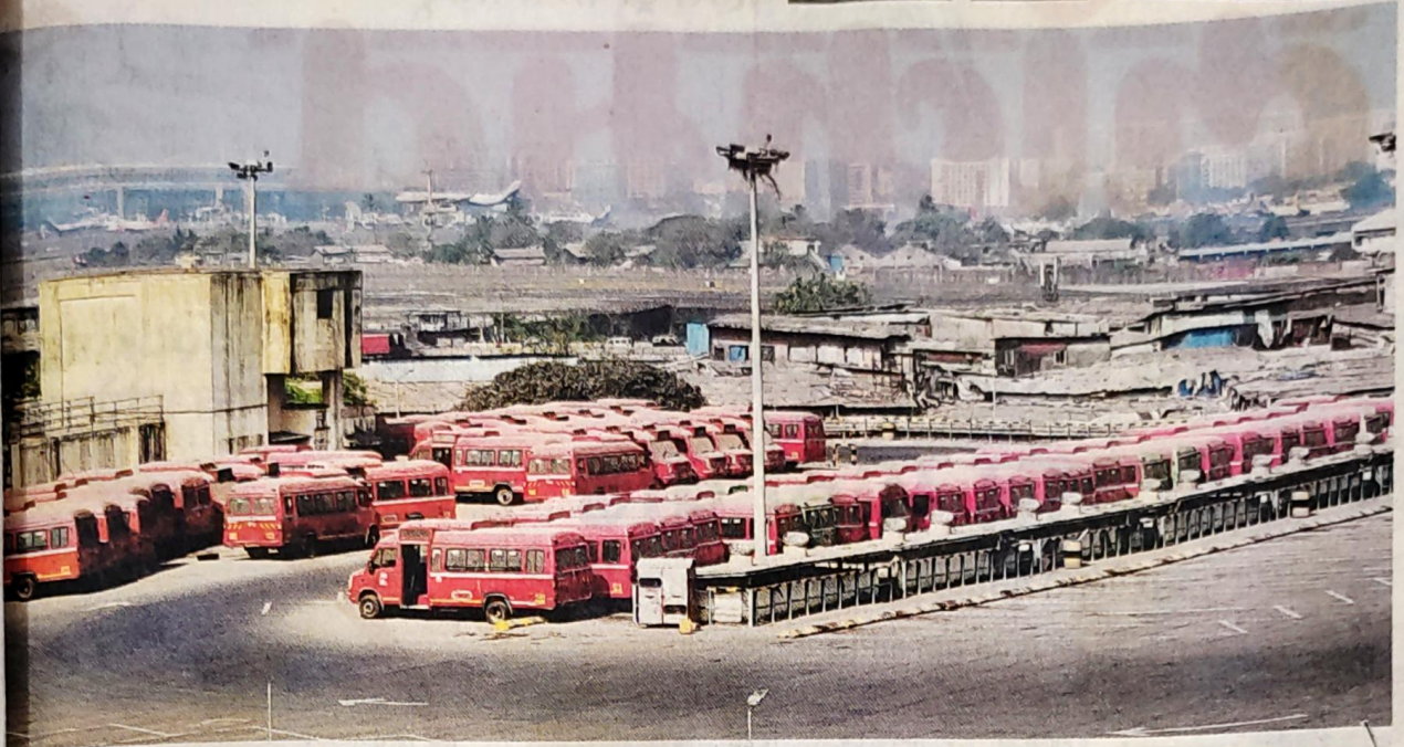
मेकडील लालबहादूर शास्त्री मार्गावरील कुर्ला डेपोमध्ये आजचडीला जाणारे असलेल्या मिनी एसी बस धूळखात पडून आहेत.